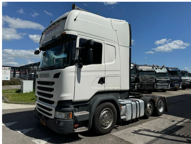
Scania R450 6X2 EURO 6 HYDRAULIC AUTOMATIC