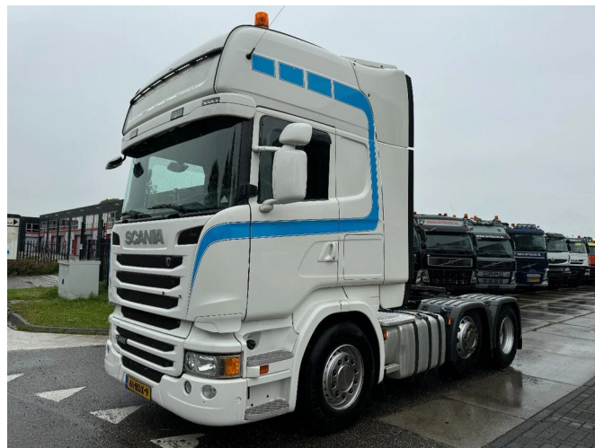
Scania R450 6X2 EURO 6 + RETARDER + STEERING AXLE