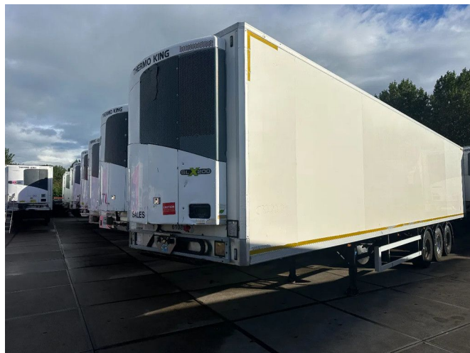
Montracon 10 X THERMO KING SLX 200 -13,4X2,5X2,6 ME...