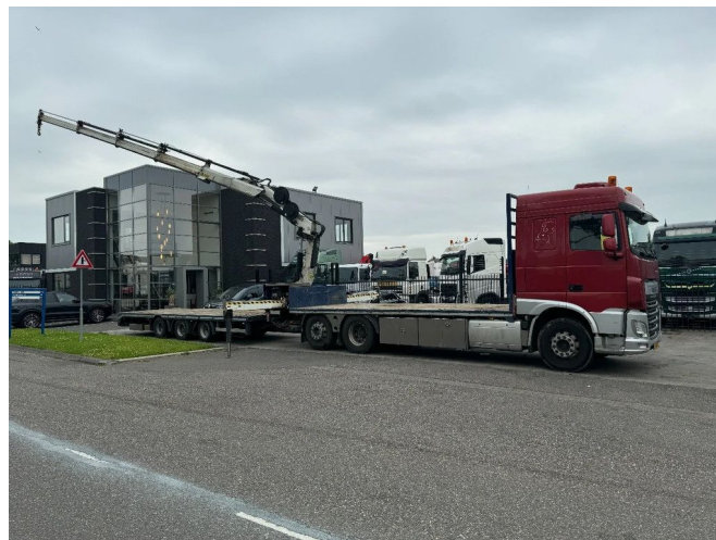
DAF XF 510 6X2 EURO 6 + HIAB 166 HI PRO + REMOTE C...