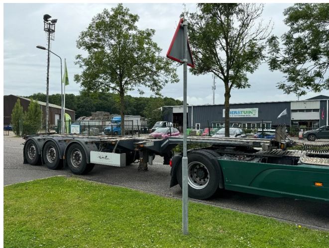
D-TEC FT-LS S FLEXITRAILER 2X20 40 45 FT SAF AXLE