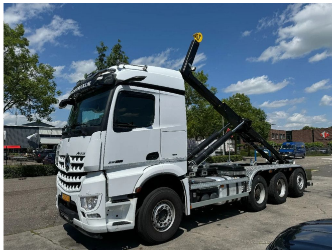
Mercedes-Benz Arocs 3258 8X4 NEW HOOKLIFT HYVA 26T