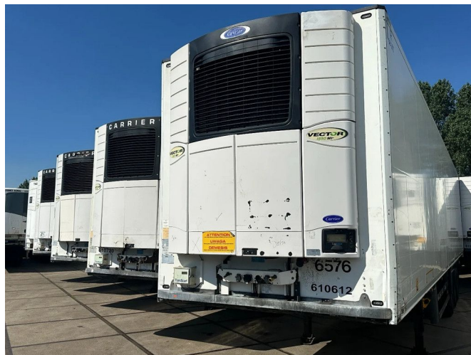
Schmitz Cargobull 40 X CARRIER 1850 MT D/E SAF AXELS