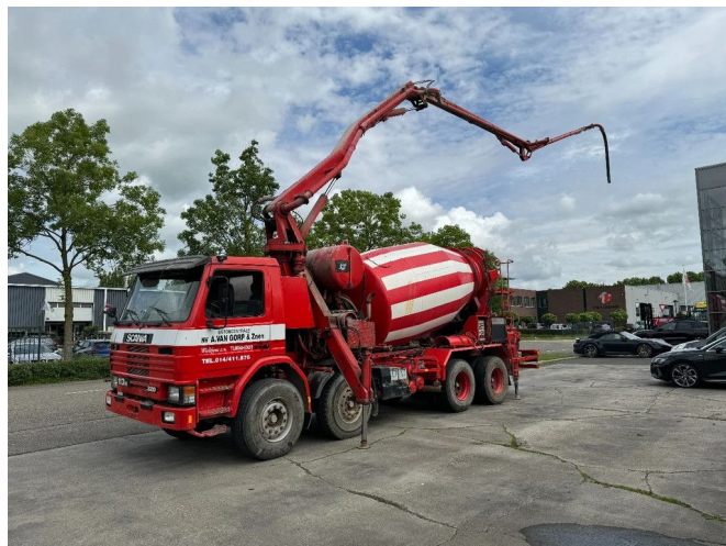
Scania P113-320 8X4 MIXER 9M3 + 24M PUMP + REMOTE...