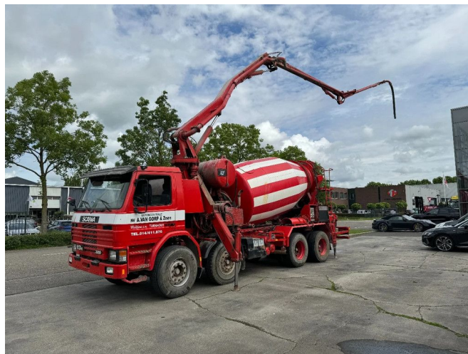
Scania P113-320 8X4 MIXER 9M3 + 24M PUMP + REMOTE...