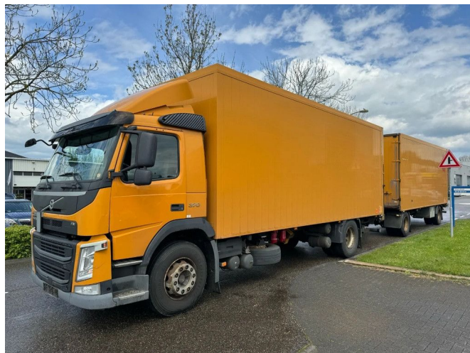
Volvo FM 370 4X2 EURO 6 + HANGER + CARGOBOX + CA... Referentienummer: VO705324-2-COMBI