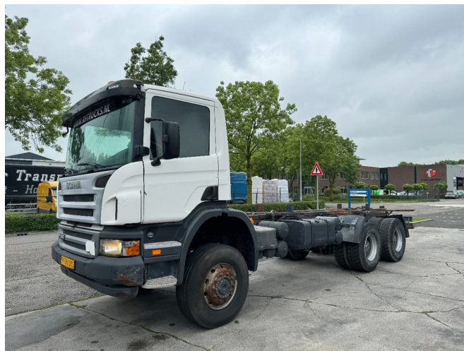
Scania P380 6X6 FULL STEEL AIRCO