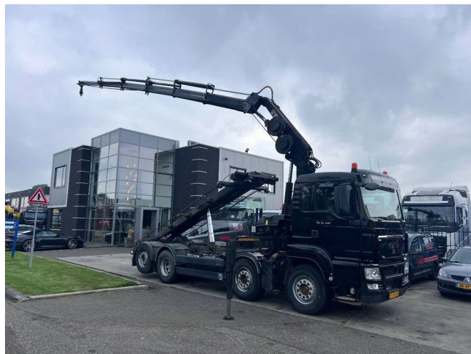
MAN TGS 35.440 8X2-4 + HIAB 220C-5 REMOTE + CABLE L... Referentienummer: MA055351-K