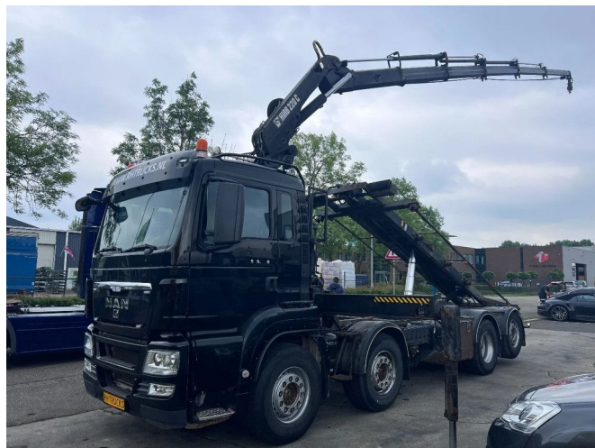
MAN TGS 35.440 8X2-4 + HIAB 220C-5 REMOTE + CABLE L... Referentienummer: MA055351