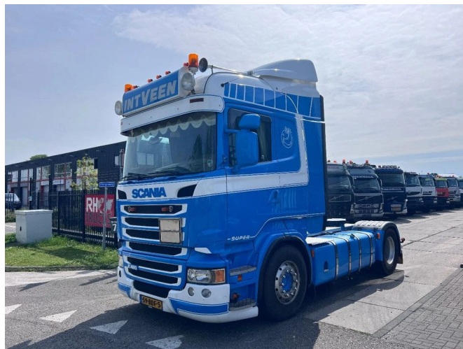
Scania R490 ADR RETARDER 4X2 EURO 6