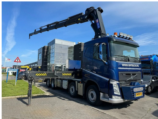
Volvo FH 500 8X2 EURO 6 + HMF 8520-O-K6 + REMOTE C...