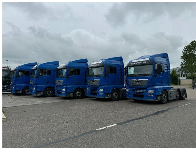
MAN TGX 26.460 XLX 6X2-2 EURO 6 LIFT AXLE