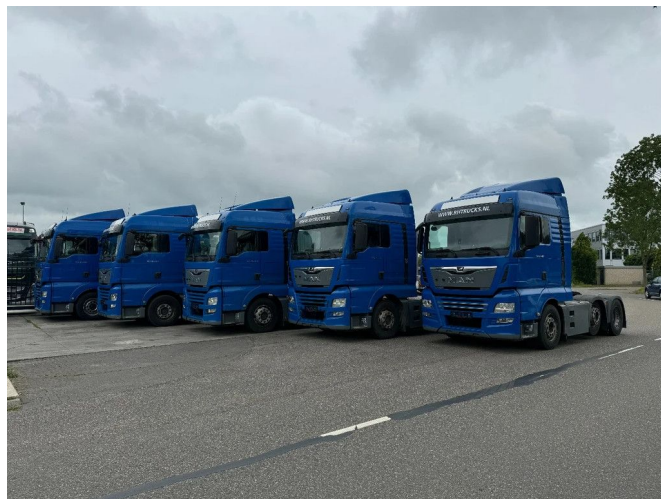
MAN TGX 26.460 XLX 6X2-2 EURO 6 LIFT AXLE