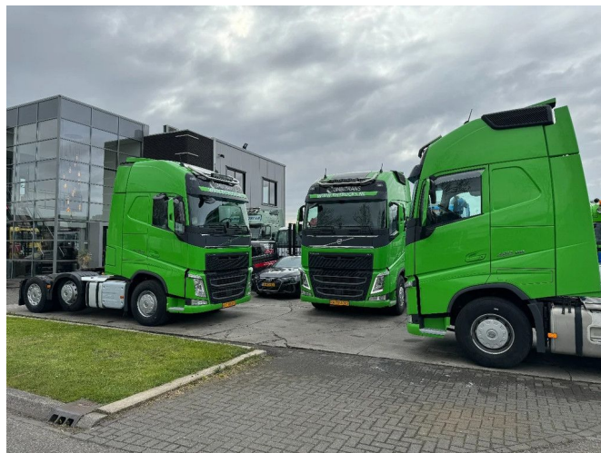
Volvo FH 460 6X2 EURO 6 + STEERING AXLE + HYDRAULICS