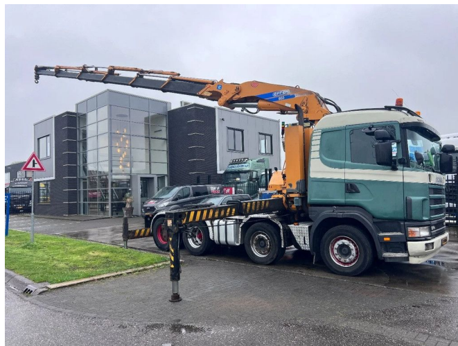
Scania R124-420 8X4 EURO 3 + EFFER 950/6S + 1 + REMOTE