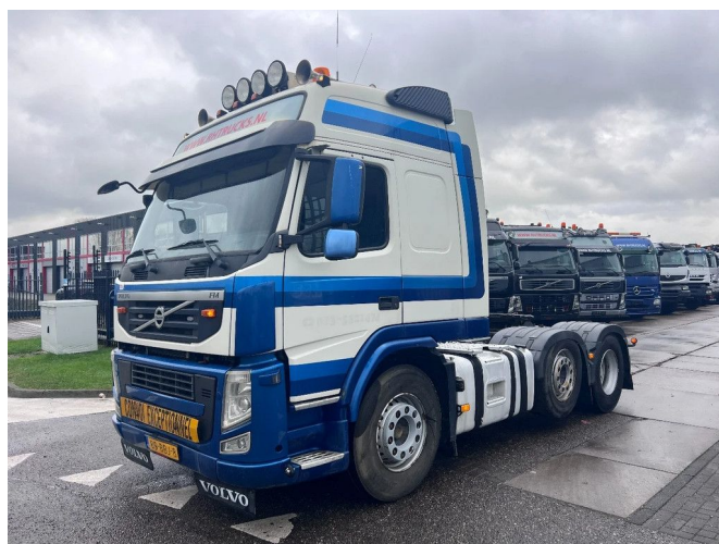
Volvo FM 12.460 6X2 EURO 5 HYDRAULIC + i-Shift APK