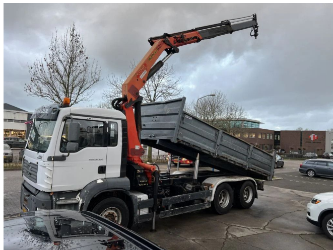
MAN TGA 26.390 6X4 + PALFINGER PK17502 + TIPPER - F... Referentienummer: MA449650