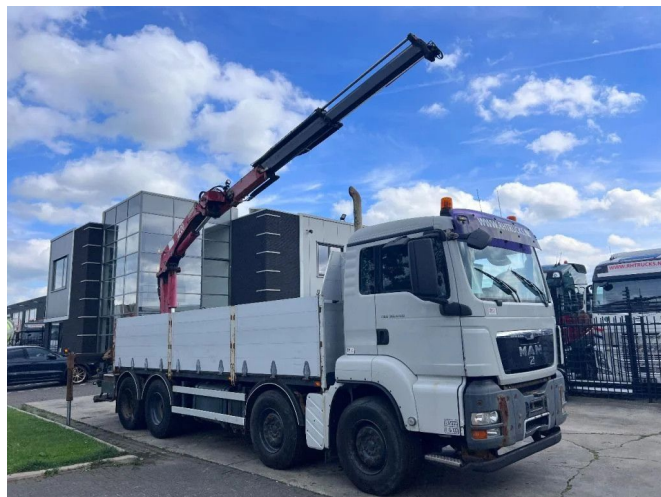
MAN TGS 35.440 8X4 + HMF 2220 K2 MET REMOTE