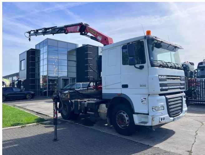
DAF XF 105.410 4X2 EURO 5 MANUAL + PALFINGER PK16...