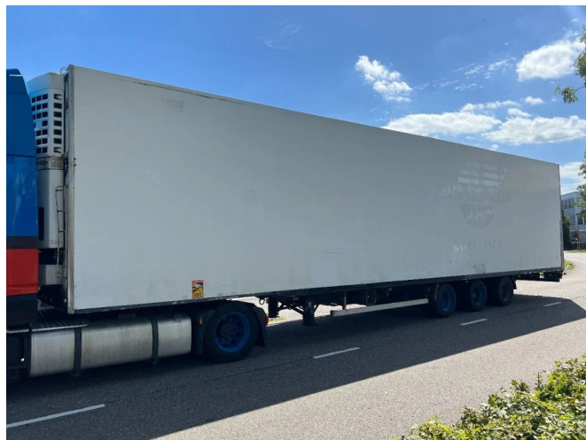
VAN ECK UT3LN - MEGA + ROLLENBAAN + THERMOKING...