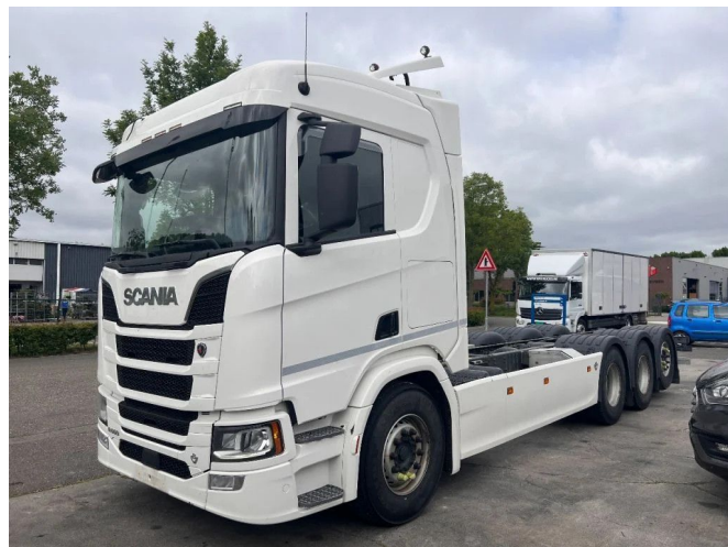
Scania R650 V8 8X4 RETARDER - CHASSIS