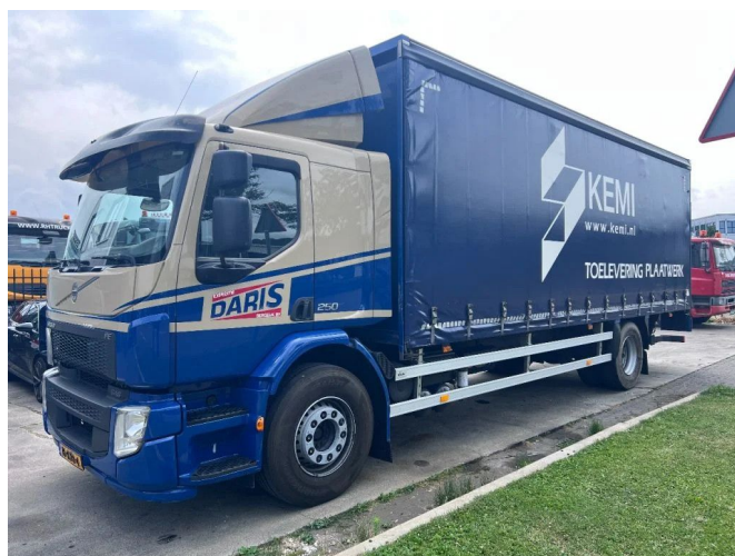
Volvo FE 250 4X2 EURO 6 - 19 TON + DHOLLANDIA