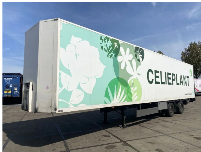
Burg 2 AS GESLOTEN LAATSTE AS GESTUURD