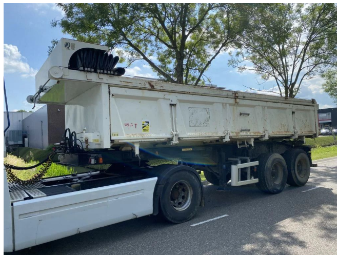
CIF 2 AXLE - STEEL SUSPENSION - TIPPER