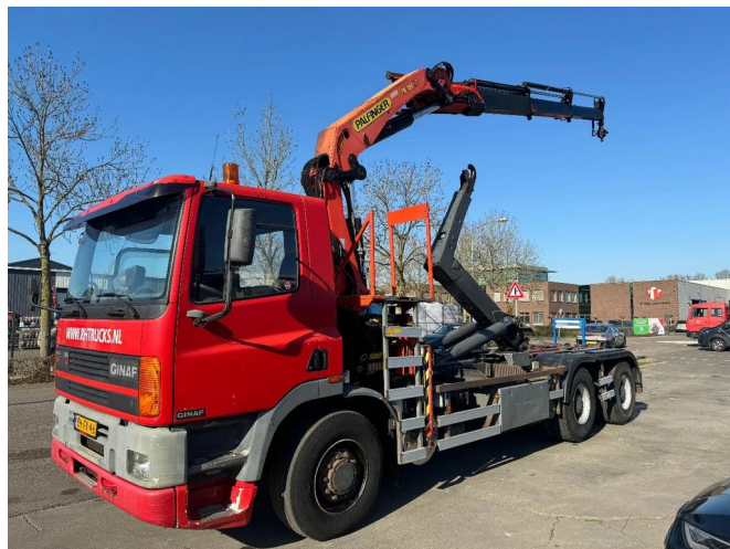
Ginaf M 3232 S 6X2 - EURO 2 + PALFINGER PK19000 + R...