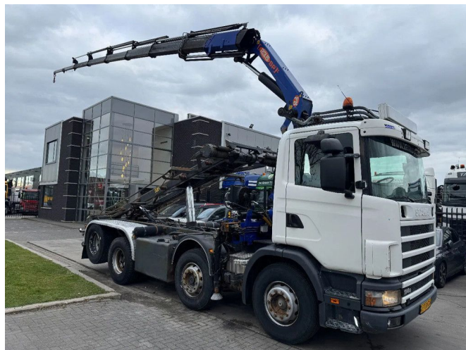
Scania R114-380 8X2 - EURO 3 + PM 23525SP LC 2013! + ...