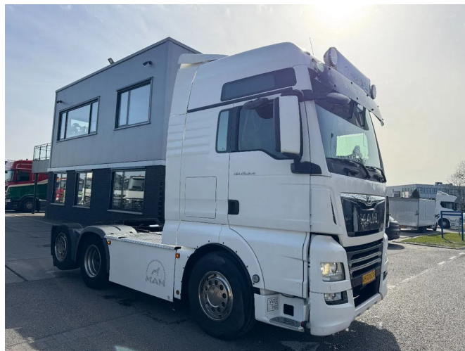
MAN TGX 26.500 6X2 - EURO 6 + LIFTING AXLE