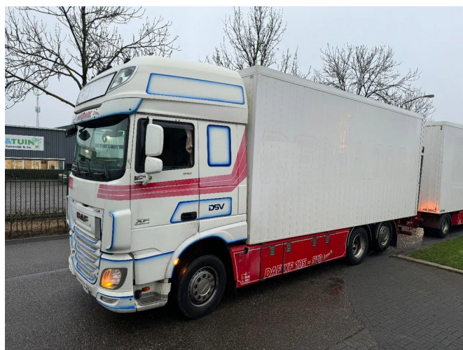
DAF XF 510 6X2 - EURO 6 + RETARDER + ZEPRO LIFT + ...