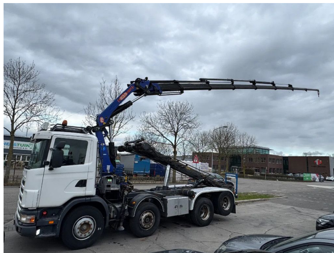
Scania R114-380 8X2 - EURO 3 + PM 23525SP LC 2013! + ...