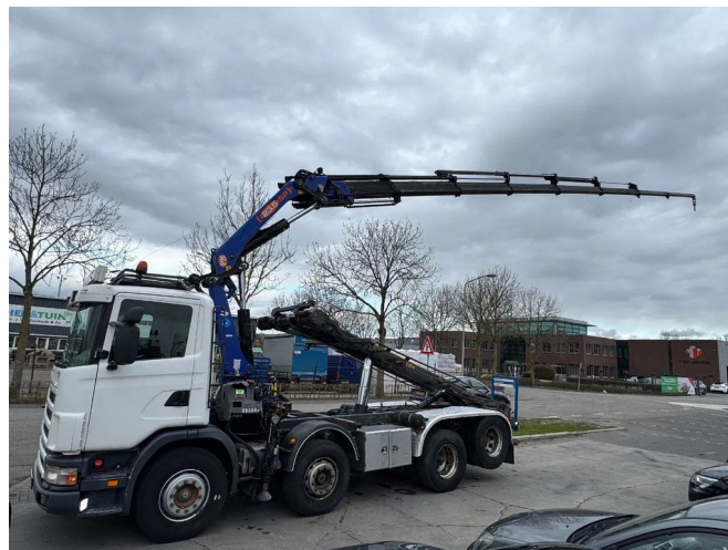
Scania R114-380 8X2 - EURO 3 + PM 23525SP LC 2013! + ...