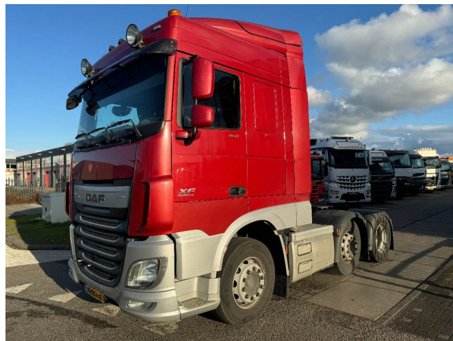
DAF XF 460 6X2 EURO 6 TÜV TILL 27-11-2025