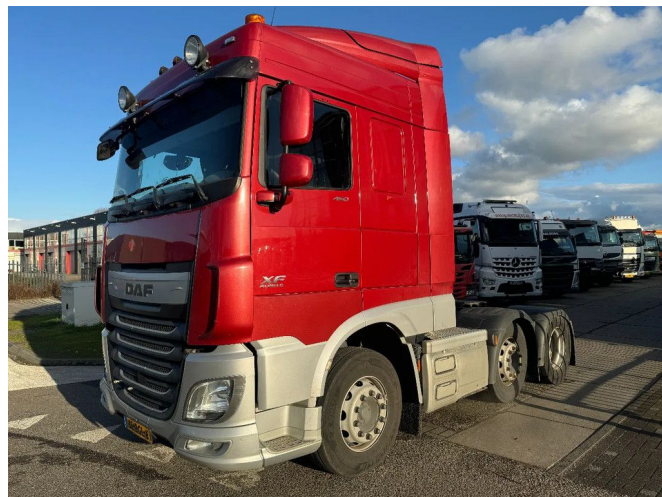
DAF XF 460 6X2 EURO 6 TÜV TILL 27-11-2025