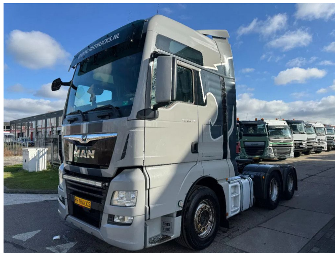
MAN TGX 28.500 6X2 - EURO 6 + RETARDER + LIFT AXLE