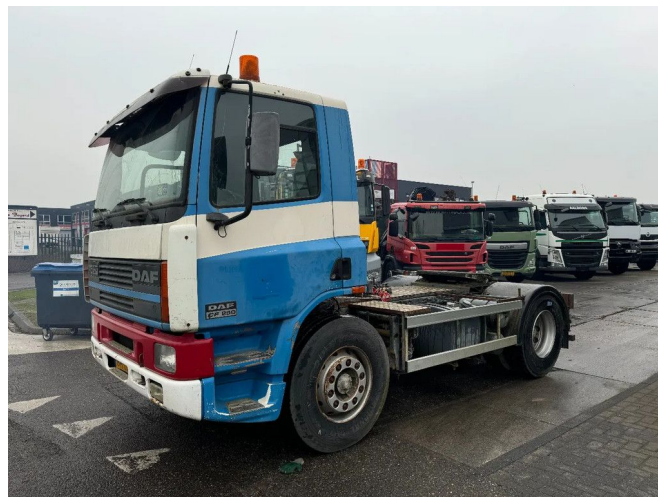
DAF CF 75.250 4X2 EURO 2 MANUAL GEAR 6 TYRE HYD...