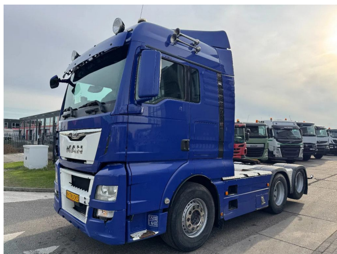
MAN TGX 28.480 6X2 - EURO 6 + KIPPER HYDRAULICS + ...

• ABS • Aire acondicionado • Bocina de aire • Cabina de dormir • Cierre central de puertas • Cruise control • Freno de motor reforzado • Limitador de velocidad • Luces brillantes • Luces de niebla • Nevera • Parasol • PTO • Radio / reproductor de CD • Spoiler para el techo • Tanque de combustible de aluminio • Ventanas eléctricas