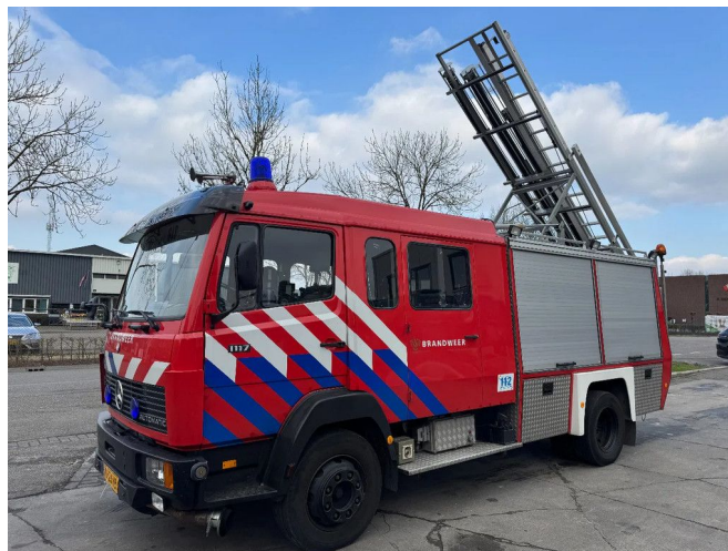
Mercedes-Benz 1117 - FULL EQUIPMENT INCLUDED F... 4x2