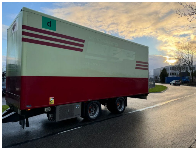
Fliegl TPS 180 - 2 AXLE BPW + TRS COOLING