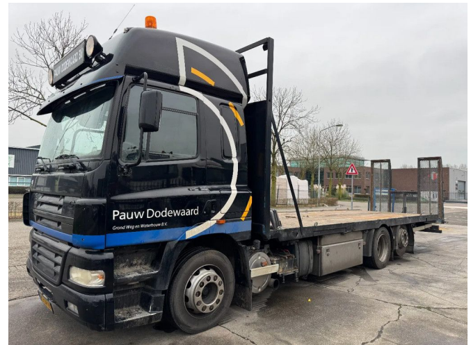
DAF CF 85.340 6X2 - HYDRAULIC RAMP 2M + BED 8.65 M

• ABS • Aire acondicionado • Cabina de dormir • Caja de