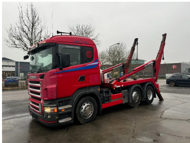
Scania R420 6X2 MULTILIFT SLT 180