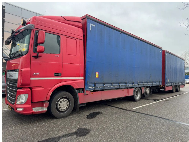
DAF XF 410 6X2 - DRACO MZS 218 HANGER + EURO 6 + L...