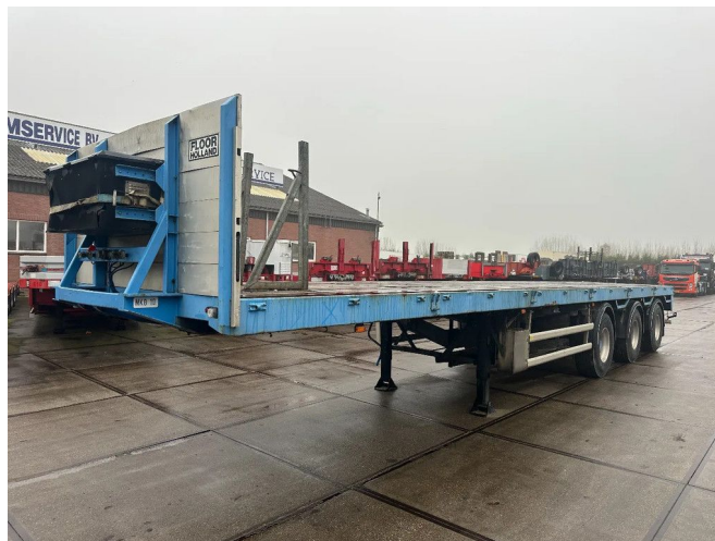
Floor 2 ASSEN GESTUURD