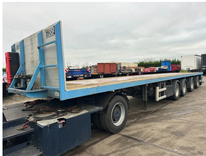
Floor 2 AXLE STEERING an 2 LIFT AXLE