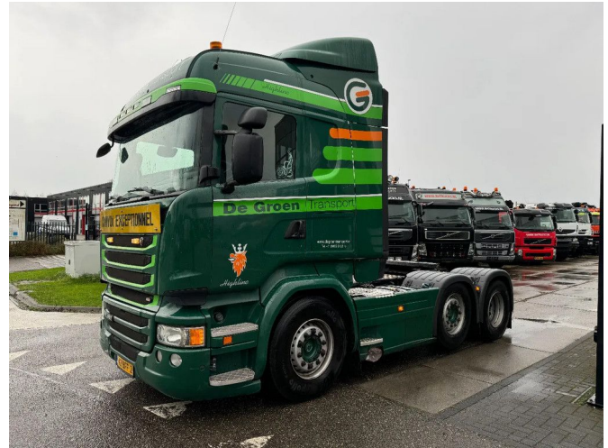
Scania R450 6X2 EURO 6 RETARDER LIFT + STEERING A...