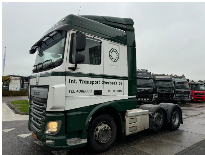
DAF XF 460 6X2 - EURO 6 + LIFT AXLE + STEERING AXLE

• ABS • Aire acondicionado • Cabina de dormir • Cierre central de puertas • Cruise control • Freno de motor