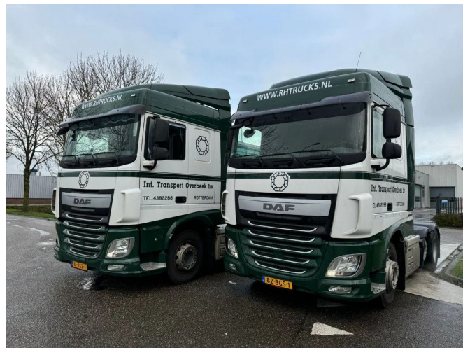
DAF XF 460 6X2 - 2 UNITS!! - EURO 6 + LIFT AXLE + STEE...