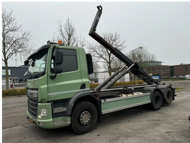
DAF CF 440 6X2 EURO 6 21T VDL HOOK TÜV 02-2025